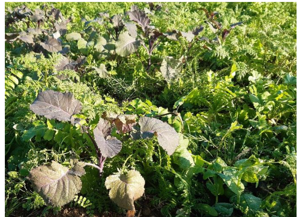
Abb.: Eine für den Silomais entwickelte Zwischenfruchtmischung. Die Mischungspartner nutzen den Platz durch unterschiedlichste Wuchsformen optimal aus und behindern sich dabei nicht.