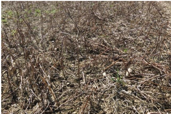
Abb.: Abgefrorene Zwischenfrüchte: Gelbsenf (oben) hinterlässt helles Material, während ein Gemenge, das u.a. Phacelia und Leguminosen enthält, dunkles Material hinterlässt. Hier erwärmt sich der Boden im Frühjahr schneller. Die Mulchschicht bieten in beiden Fällen Nahrung für Regenwürmer und andere Zersetzer.