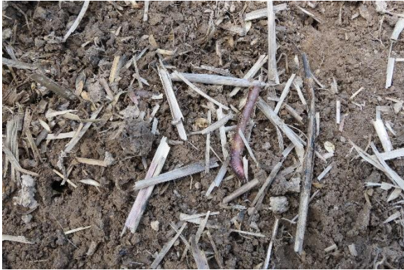
Abb.: Wer die Möglichkeit zur Mulch- oder Direktsaat hat, kann das Bodenleben aktiv fördern. Dieses Bild entstand Ende Mai 2020 auf einer Fläche, die nur 2 cm bearbeitet wurde. Nach wochenlanger Trockenheit – die Krume der Nachbarflächen waren nahezu ausgetrocknet – tummelten sich unter der Mulchschicht Regenwürmer und die Erde war komplett durchfeuchtet.

Durch die Beschattung der Flächen verhindern Zwischenfrüchte ein Austrocknen der obersten Bodenschichten (geringere Evaporation) sowohl während ihres Wachstums als auch als Mulchschicht im Frühjahr. Im Gegenzug steigt zwar die Wasserverdunstung durch die Pflanzen (Transpiration), allerdings ist die Transpiration bei den meisten Sorten wesentlich geringer als die Verdunstung über dem freiliegenden Acker. Außerdem fangen Zwischenfrüchte erhebliche Taumengen auf.